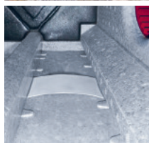
Appareil de ventilation (monobloc)