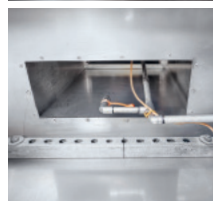
Gaine de la hotte d'aspiration d'une cuisine gastronomique